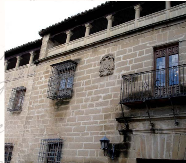
Exterior del Archivo Histórico Municipal de Baeza

También hay que destacar la labor de beneficencia que llevó a cabo la ciudad, por un lado con las clases más desfavorecidas y por otro lado con los hospitales que se encargaban de cuidarles. Del total del presupuesto que el Ayuntamiento tenía para los gastos anuales, dedicaba en torno a unas 3.000 pesetas a los gastos de beneficencia. El número de pobres con el que contaba Baeza en 1918 era de 2.319. Anualmente se elaboraban unas listas de familias pobres a las que se les prestaba gratuitamente asistencia médica y farmacéutica, como podemos ver en la exposición. Dentro de las actividades benéficas que se hicieron en la ciudad en 1912, hay que destacar la celebración de las "Kermeses", que eran unas verbenas que se celebraban al aire libre con las que se obtenía dinero a beneficio de los pobres, al igual que las corridas de toros cuyo dinero iba destinado al Hospital de la Concepción para ayudar a curar a los enfermos y a los más necesitados. Podemos ver en la exposición un expediente de repatriados de guerra de 1914 donde se pide que se constituyan unas Juntas Locales puesto que se había llevado a cabo una suscripción para socorro