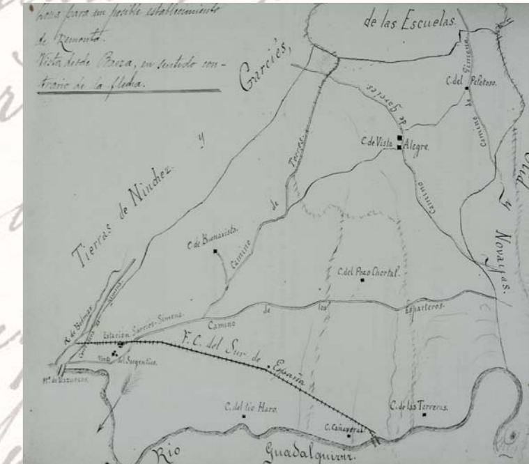
Croquis terrenos Remonta. 1914

Baeza participó en diferentes homenajes aportando una gran cuantía económica como fue el que se realizó a Galdós. Pero hubo un homenaje que se organizó en la ciudad y que con toda probabilidad participaría Machado, y éste fue el que se realizó a Cervantes. Podemos ver diversa documentación en ambas exposiciones al respecto. En el discurso que ofreció Leopoldo de Urquía, destacamos las siguientes palabras: "...no se trata de glorificar a Cervantes, cuyo nimbo de gloria irradia a través de los siglos más brillantes resplandores, sino de resucitar a Don Quijote, de evocar el espíritu caballeresco de nuestra raza, de espolear a Rocinante para lanzarlo en busca de nuevas aventuras..."